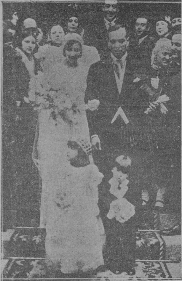
El célebre guardameta Ricardo Zamora al salir de la iglesia con su esposa D.ª Rosario de Grassa, después de contraer matrimonio.