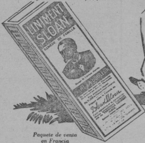
Paquete de venta en Francia

De venta en las farmacias, droguerías y centros de específicos del mundo.