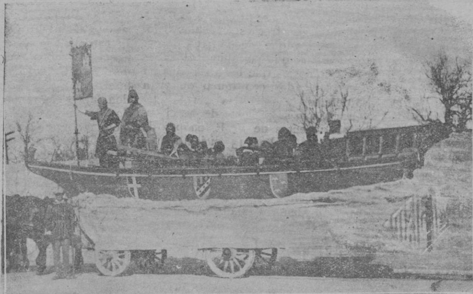
Una de las carrozas que presentó el Ayuntamiento de Palma en el desfile del domingo