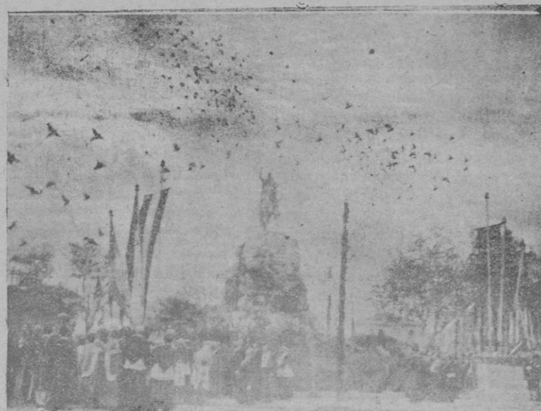
Momento de la suelta de las dos mil palomas ante la estatua del Conquistador el 31 de Diciembre