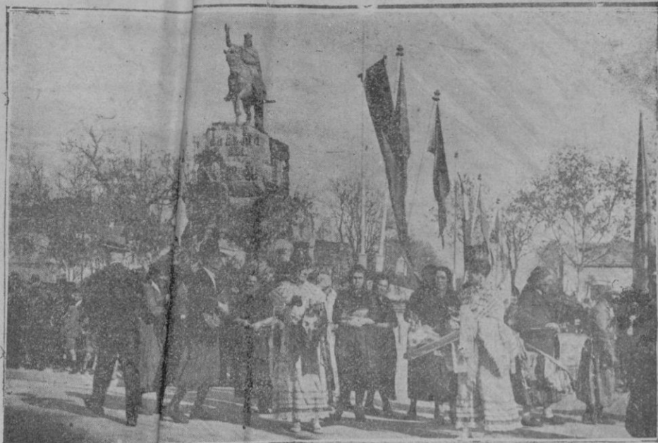
Las águilas, de ensa, que figuraban en la representación de dicho oblo en la manifestación del domingo