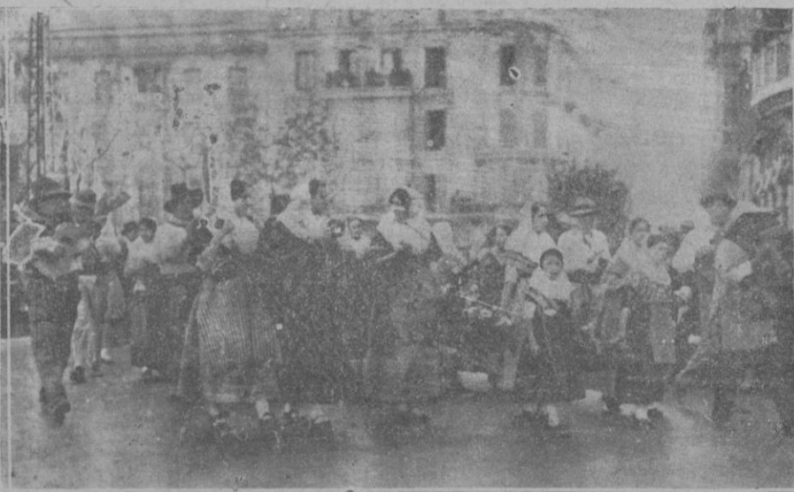
Las vendimiadoras que figuraban en la representación de Binisalem

Entre los gravámenes cuya exención proclama la Carta de franqueza, figuran como principales: la «deuda» que era un tributo que recaía sobre la importación, exportación o el