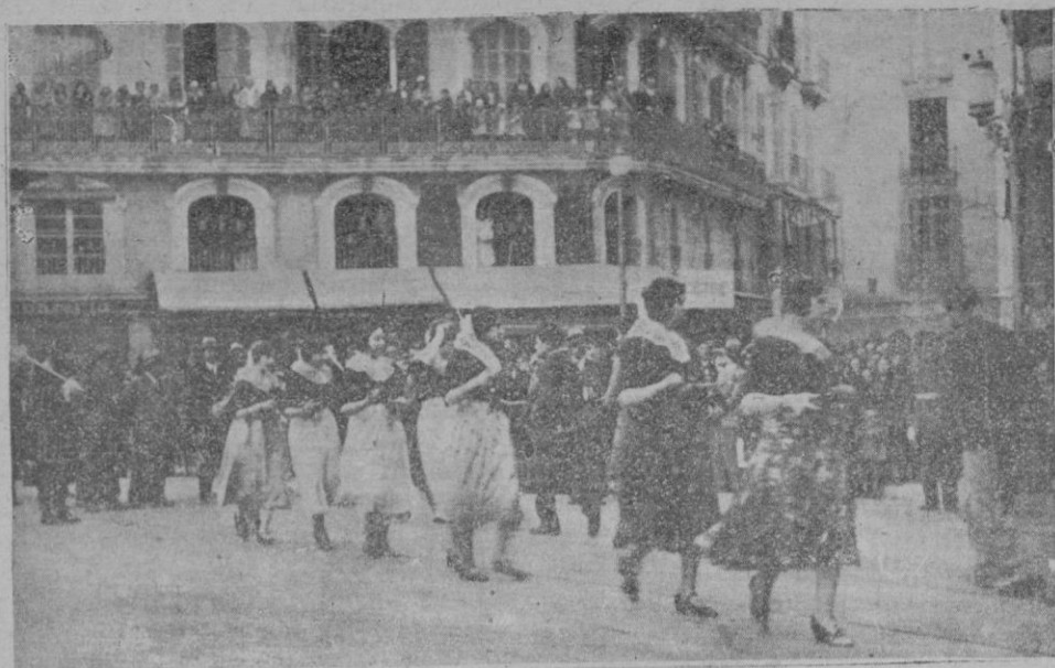
«Ses revetleres» que figuraban en la representación de la ciudad de Inca, bailando en la Plaza de Cort