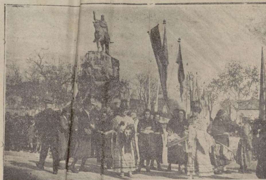
Las águilas, de ensa, que figuraban en la representación de dicho folio en la manifestación del domingo