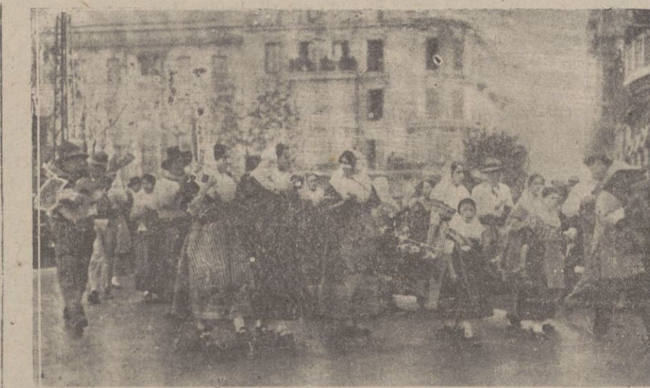
Las vendimiadoras que figuraban en la representación de B'nisalem

Quedan abolidas en nuestra Carta las pruebas del agua y del hierro caliente y el combate judicial, en pfo-