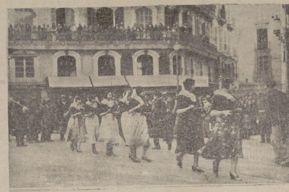
«Ses revetleres» que figuraban en la representación de la ciudad de Inca, bailando en la Plaza de Cort