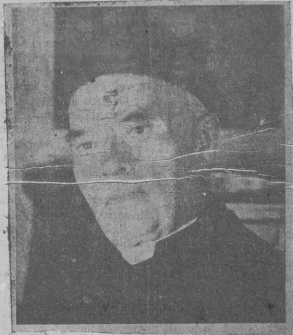
Monsiñor Verdier, nombrado Arzobispo de Paris

Al volver a su casa preguntó a su mujer que qué había para cenar. Cuando supo que tenían patatas se dirigió muy serio a la cocina—donde nunca entraba—y ante su mujer, que extrañada le seguía, le preguntó a la cocinera: —¿Dónde están las mondas de las patatas, Sabina? —En el cubo de la basura, señor. —¿Quiere usted enseñármelas? —¿Qué idea! ¿Para qué?—gritó la señora—. No va a tocar, mientras guisa, la basura. Y sacando las mondas del cubo de la basura las examinó detenidamente. —¿Lo que me figuraba! Desperdicia usted la mitad de la substancia alimenticia. —¿Yo las pelo lo mejor que puedo, señor!—exclamó Sabina. —Pero ¿que té ha dado hoy?—le preguntó su mujer a media voz. —Que traigo un aparato para que Sabina lo emplee de ahora en adelante: el «Superveloz». Dame una patata cruda. Y siguiendo las indicaciones del prospecto, Borax logró pelar una pa-