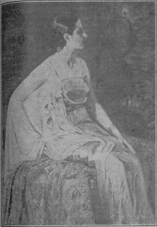
«Céfora», cuadro de M. Tur de Montis, Catálogo, 121

Informaciones de la Agencia Mencheta para LA ALMUDAINA