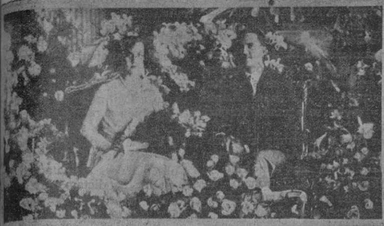
La princesa María de Bélgica y su prometido, el príncipe Humberto de Italia, el día de la petición de mano, rodeados de las canastillas de flores con que fueron obsequiados.