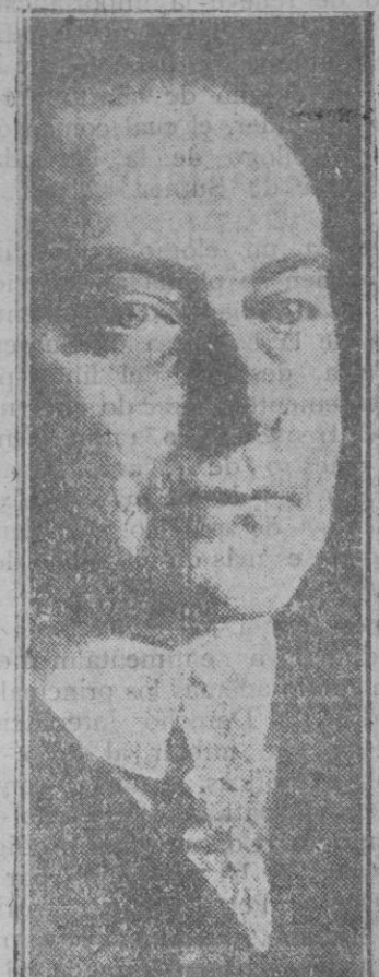
Curtius, substituto interino de Stressemann

compañía, cuyos consejos nos dañan, y esto ocurre también con los libros cuando son malos. Estos al servicio de inteligencias en formación y en manos de personas de escasa cultura, son un explosivo y para los ya capacitados un veneno sutil que envenena deleitando. Demoledores son los efectos del libro pernicioso en manos de la juventud. Dos tendencias nocivas predominan hoy con referencia al libro: la que podríamos llamar truculenta y sanguinaria y la pornográfica. Y estos