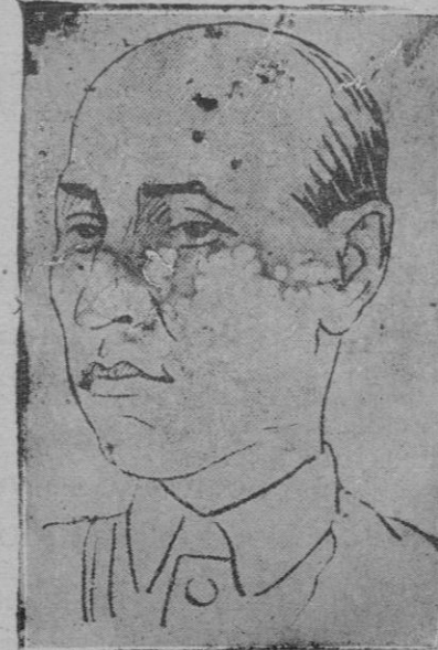
El general Chang Kai Chek, presidente del Gobierno nacionalista chino

Pero así como la verdad no se doblega ante la mentira, la fé alzó una barrera infranqueable ante el amor de la tierra. Y así como amor se torna odio cuando no es pura la fuente que le vivifica, así el hierro impío, al mandato del inhumano Olibrio, segó el tallo delicado y tierno de la Margarita para que volara libre en la eternidad, a florecer en los brazos del Amado, suave con la suavidad de la aurora, bello con la belleza del sol, y duce con