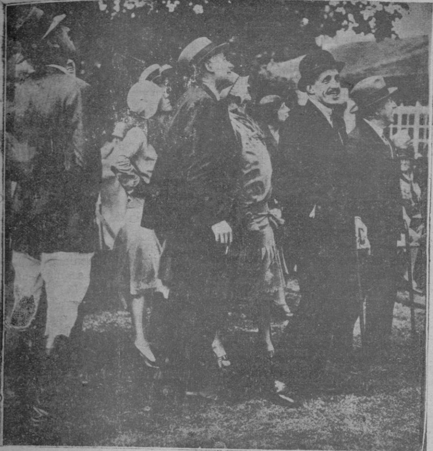
El Rey de España contemplando la evolución de los aeroplanos en la fiesta de aviación