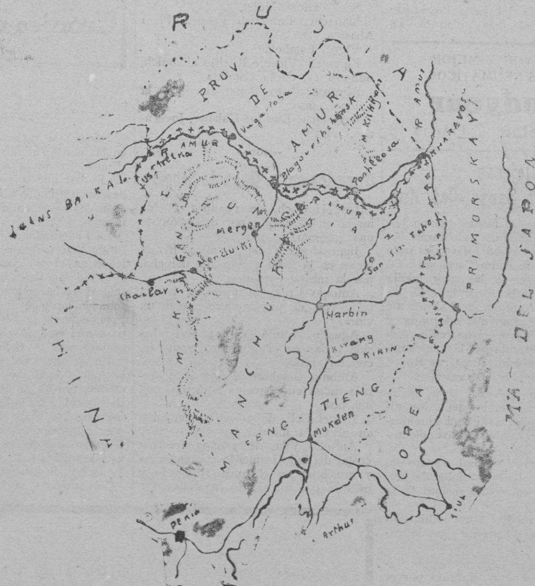
La frontera ruso-china, donde se han concentrado elementos de guerra, en perspectiva de una ruptura de hostilidades

Pero, allá en lontananza pintó Fouquet, en su graciosa miniatura, el amor terreno que velaba, codicioso y extasiado, la sencilla Margarita que florecía, ajena a sus mundanales asechanzas, tejiendo el hilo sutil constante y enamorado. Clibrío, el presente, quere para sí las sedas de aquella carne votada al cielo, y las mieles de aquella flor singular que arraigó en los verges escogidos y se abreva de las aguas de las fuentes eternas.