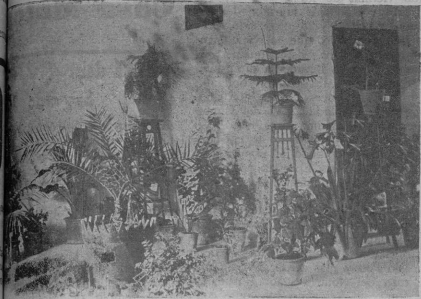
Exposición de plantas organizada por las Escuelas Nacionales de Sancellas (día 26 de mayo)