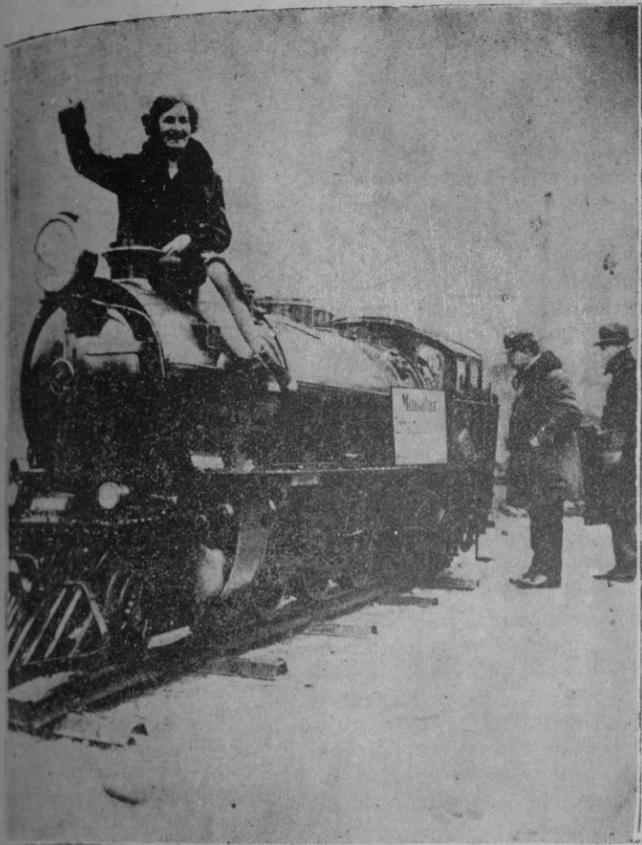
Locomotora en miniatura, construída para exhibirla en la Exposición Internacional de Barcelona