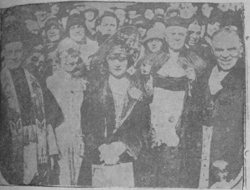
Las modistas de París, asistiendo a la función religiosa en honor de su Patrona, Santa Catalina