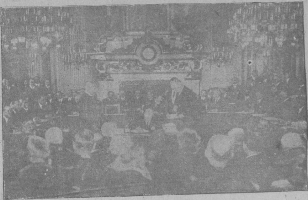
El ministro alemán, Sr. Stresemann, firmando el Pacto Kellogg, en el Salón del Reloj