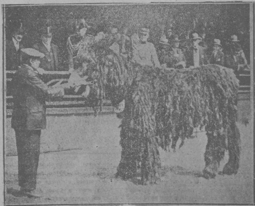
Asno de pelo largo, que figura en la Exposición francesa de animales raros