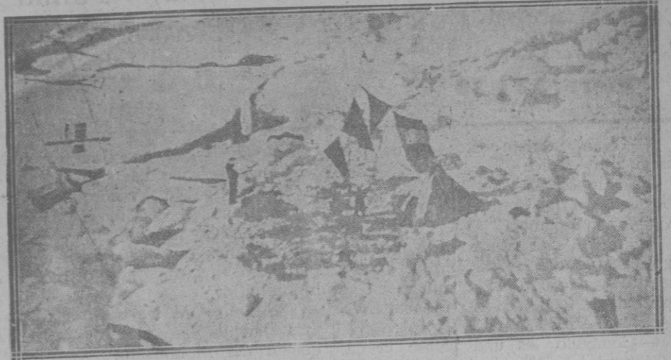
La célebre tienda roja, vista desde un aeroplano

satisfacción por lo que juntas rellizaron en Marruecos; vínculos de amistad estrecha por la ayuda que mutuamente se prestaron.