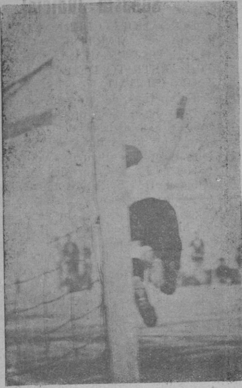
Momento en que el famoso guardameta Zamora, intentó parar vanamente la pelota que lanzó Moranta, segundo goal de la tarde