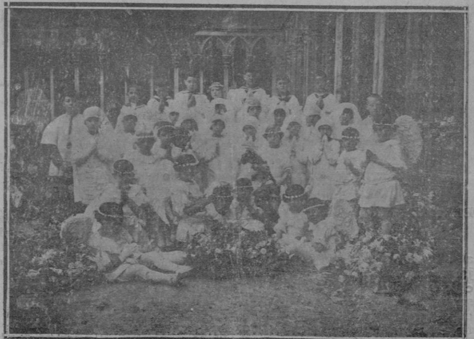
Niños que recibieron por primera vez el Pan de los Angeles, el día de la Ascensión