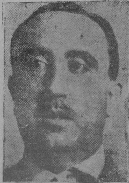
Don Honorio Maura, autor de la comedia «Las murallas de oro», estrenada con éxito en Madrid.

vecho de los dones naturales que Dios nos ha dado. Aun en aquellas provincias donde florece más la industria, el obrero está muy atrasado, relativamente al inglés, francés, belga o alemán, y es que en aquellas naciones a la par de la industria se ha ido extendiendo la instrucción popular en toda clase de aplicaciones del trabajo.