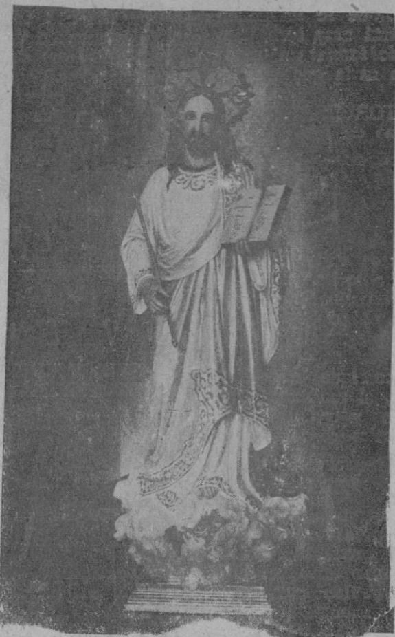
La imagen de Cristo Rey, entronizada en el nuevo oratorio de Selva.