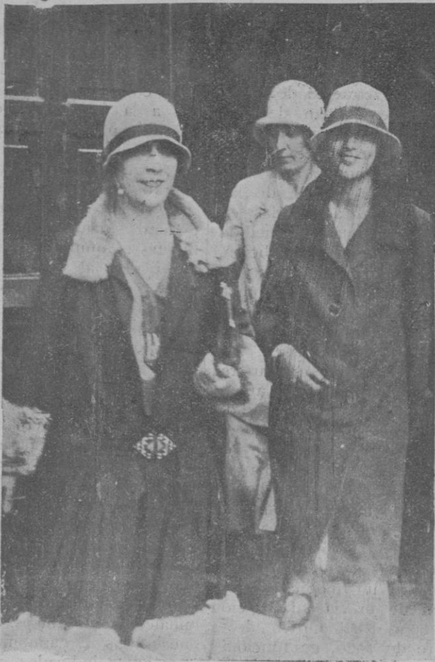
La señora esposa del Embajador alemán y su hija que se encuentran en Mallorca en visita de turismo