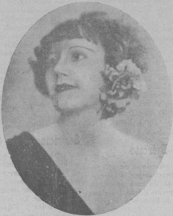
La eminente diva norteamericana Sylvette de Lamar, que esta noche a las siete da un concierto en el Teatro Principal