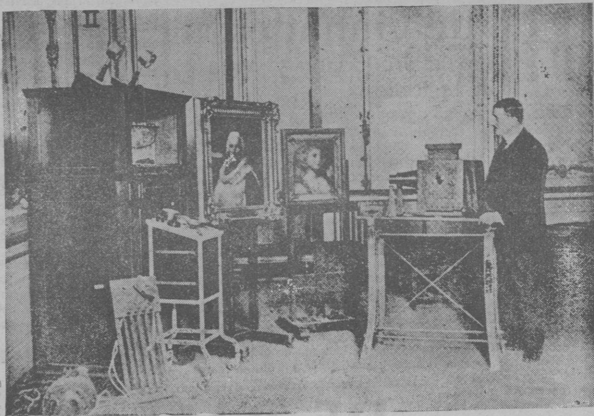
Aparato especial por el que se averigua si una pintura es un original o una copia, como también la fecha aproximada en que se pintó el cuadro

trariat. De algun modo havia d'acabar rebut de la seva finíssima obra. Li prometo que ella no será estéril.