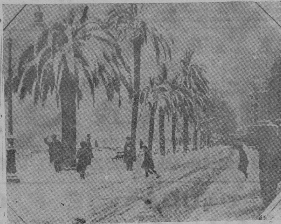
Hasta Cannes, ha llegado el temporal de nieves. Cannes, la ciudad de clima templado que buscan los hombres del Norte, para huir de las nieves de su país