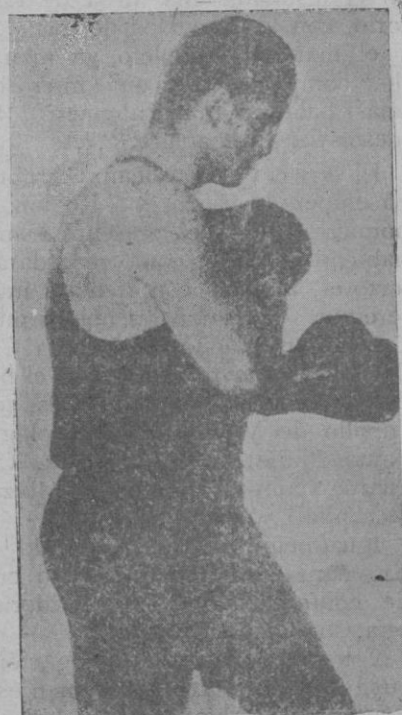
El boxeador argentino Luis Firpo, que anunció a su vuelta a la boxe con ánimo de disputar el campeonato mundial a Tunney

Una gran multitud de gentes morirá sobre la superficie de la Tierra. Se perderán todas las cosechas, y el hambre terminará la obra del cataclismo.