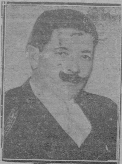
El General Arnulfo R. Gómez, candidato a la Presidencia de la República y jefe de la rebelión, que ha sido también detenido y fusilado