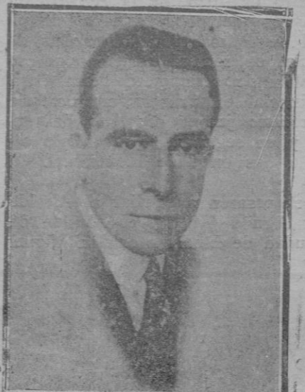
El General Francisco Serrano, candidato a la Presidencia de la República y jefe de la insurrección, que ha sido fusilado por las tropas gubernamentales