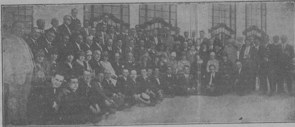
Los congresistas después del banquete celebrado en el Hotel Mediterráneo