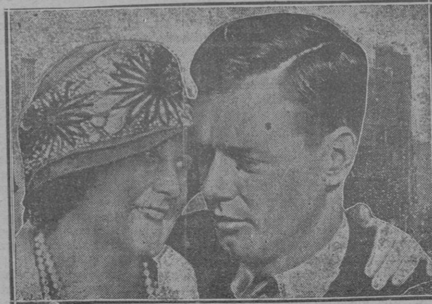
El famoso aviador al llegar a Nueva York, recibe el abrazo cariñoso de su madre