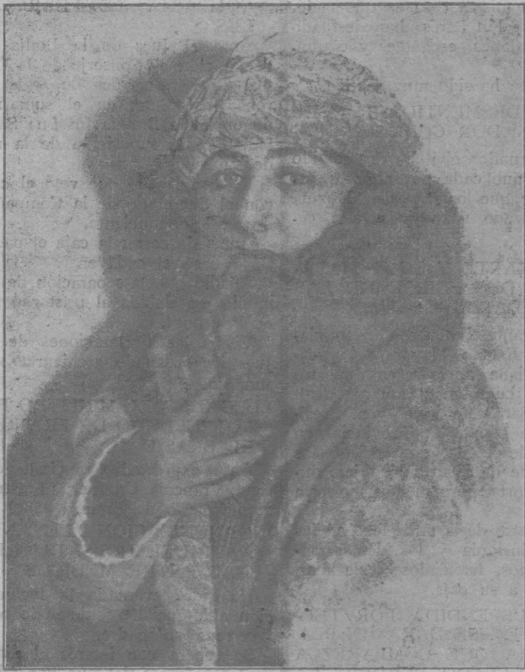
La aplaudidísima diva, Mercedes Capis, que ha de debutar en el Teatro Principal, con «El Barbero de Sevilla», considerada por la crítica como una nueva Barrientos