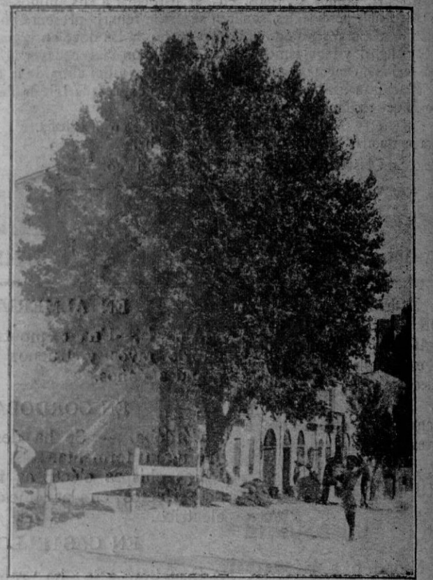
Hermoso platero de la Plaza de la Puerta de Santa Catalina derribado recientemente