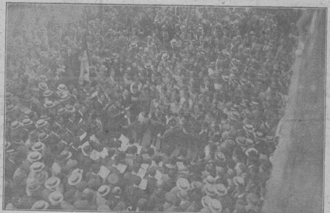
Los orfeonistas en la Plaza de Cort, rodeados de inmenso público, al ejecutar un concierto

Caminar al abrigo de los saledizos de las casas era llegar a la plaza Blanca hecho una sopa; un sueño esperar una clara. Cruzar los arroyos en busca del «Metro» o del autobús más cercano—unos quinientos metros de distancia—era una temeridad. En aquella calleja perdida de París los pocos «taxis» que pasaban iban alquilados.