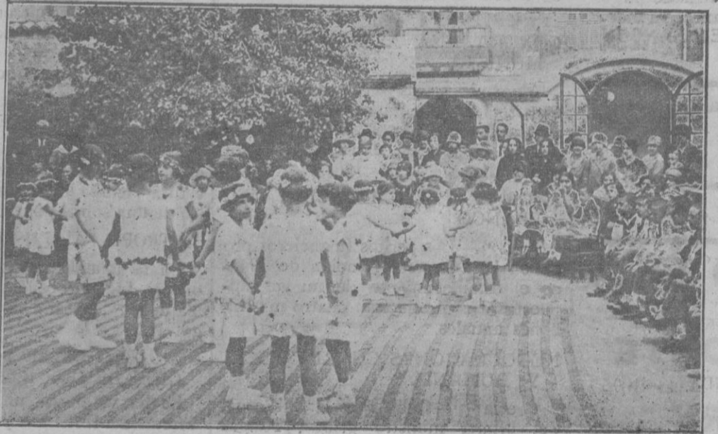
Un momento de la fiesta infantil