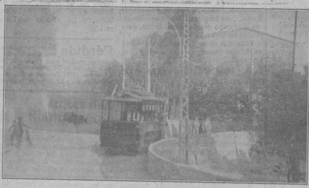
El tranvía al salir del terraplén en pleno campo y entrar en la carretera