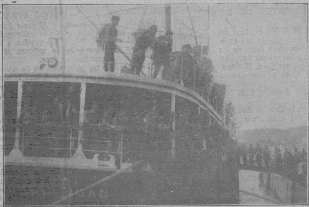
Embarque de los soldados de Mallorca para Africa, a bordo del «Jorge Juan»

setas sobre el total anteriormente calculado, habiéndose acordado aplicar dicho aumento al capítulo destinado a obras de alcantarillado.