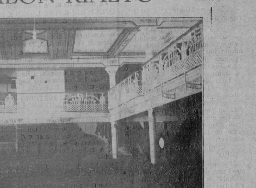
Aspecto de la sala, vista desde la pantalla, del Salón Rialto, que acaba de inaugurarse