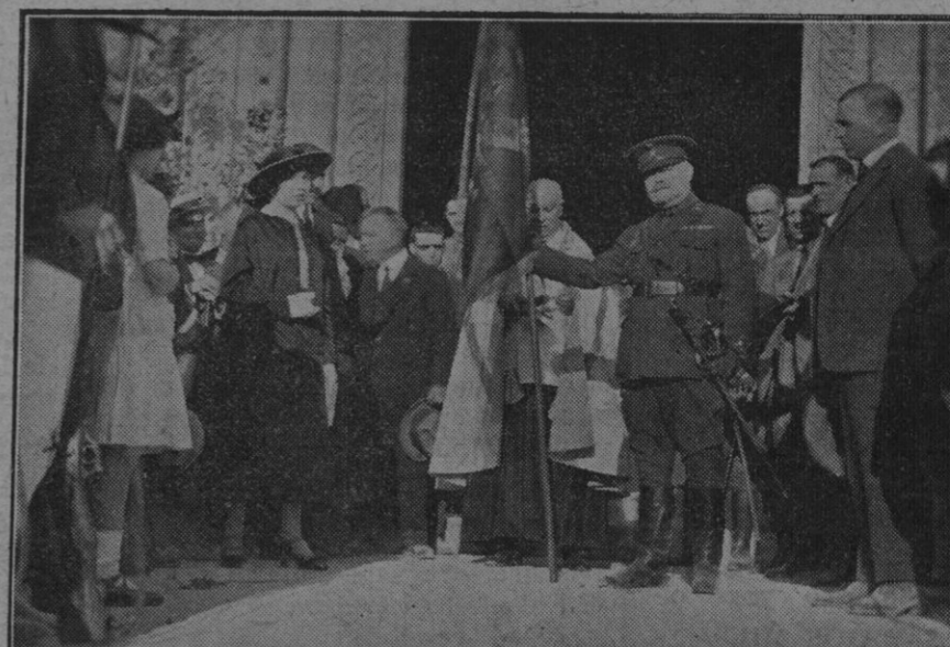
El general señor Palou de Comasema pronunciando un discurso al recibir la Bandera