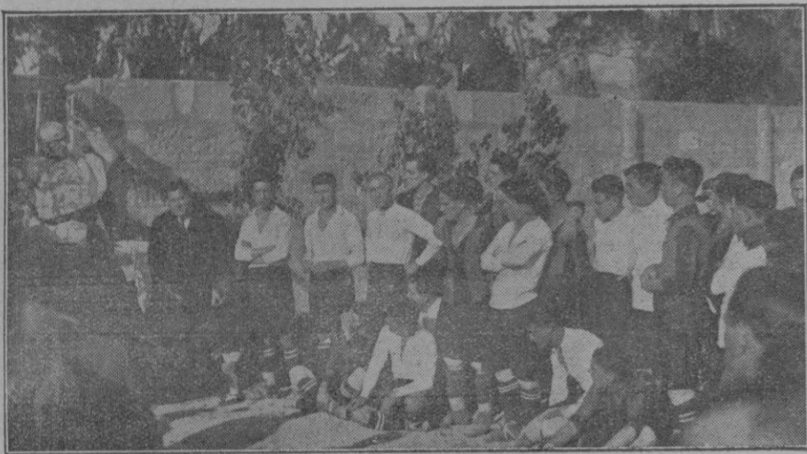
El canónigo M. I. señor Espasas dirigiendo la palabra a los reunidos después de la solemne bendición del campo