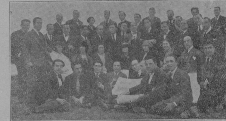
Grupo de asistentes a la manifestación artística, un concierto en las cuevas del Drach, por el Quinteto Hispania y la tip e Srta. Ottein

Mejorará la situación en la Península el viernes 25, pero quedarán las presiones en el Mediterráneo que influirán un tanto en las regiones vecinas.