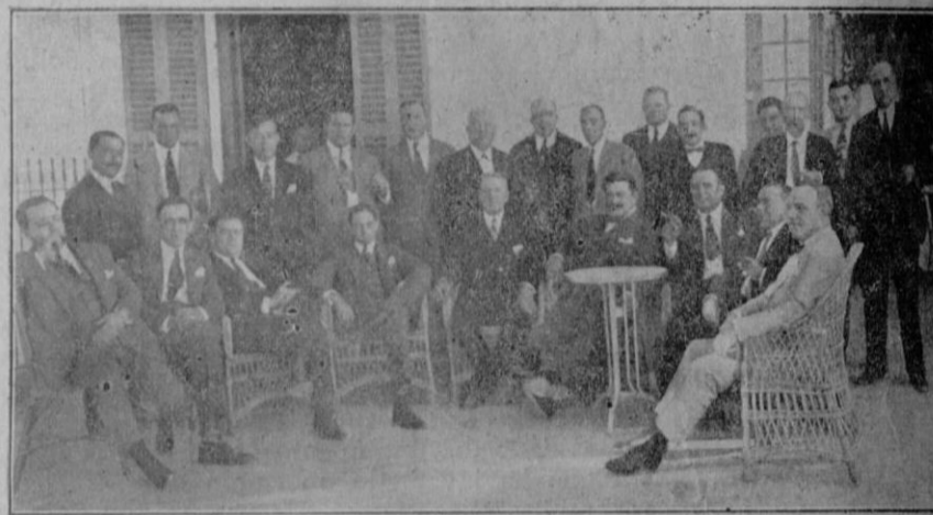
Los asistentes después del banquete en la terraza del «Mediterráneo» Hotel.