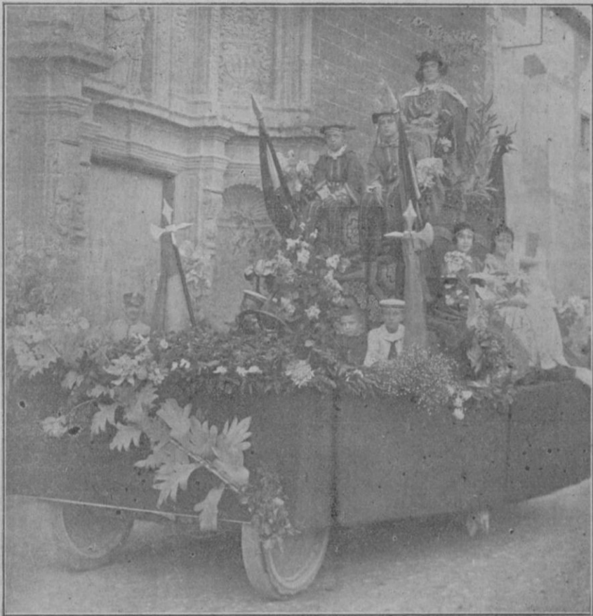
La carroza del Ayuntamiento, representando una alegoría del Rey Jaime III de Mallorca.