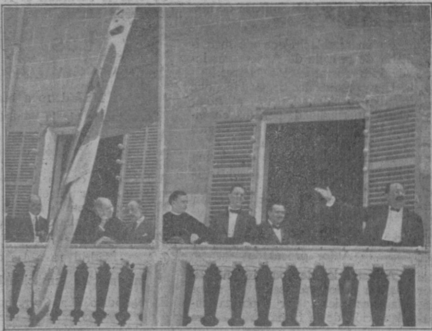
El Alcalde pronunciando un discurso desde el balcón de la Casa Consistorial después de la bendición de la bandera mallorquina.

El mismo en el salón de sesiones de su palacio con el fin de que proceda a su constitución y a la celebración de las sesiones correspondientes al período semestral.