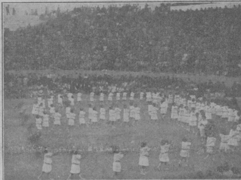
Festival escolar en la Plaza de Toros.—Ejercicios de Gimnasia rítmica por las niñas de los colegios de Inca.