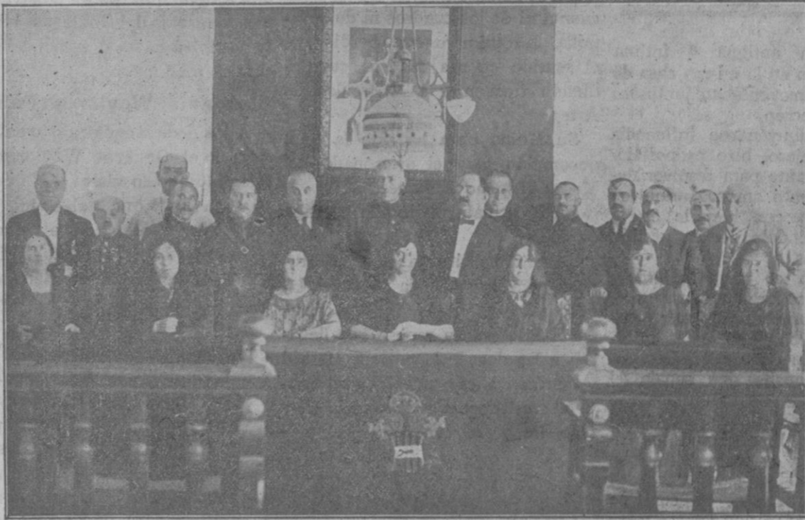
La Junta de Damas de la Cruz Roja, en el salón del Ayuntamiento, acompañada de las Autoridades y representaciones de la Cruz Roja.