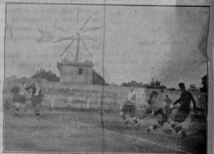
Entre el «San Julián» y el «Alfonso XIII».—El portero del primero defendiendo un goal.

—Cuando se tiene tal familia, no se puede permanecer en un pensionado de señoritas. Puede usted buscar colocación.