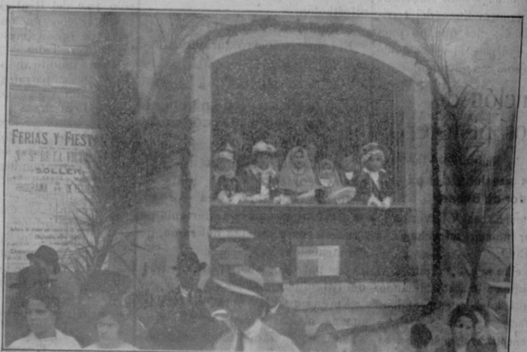
«Los valientes dones» en la Casa Consistorial