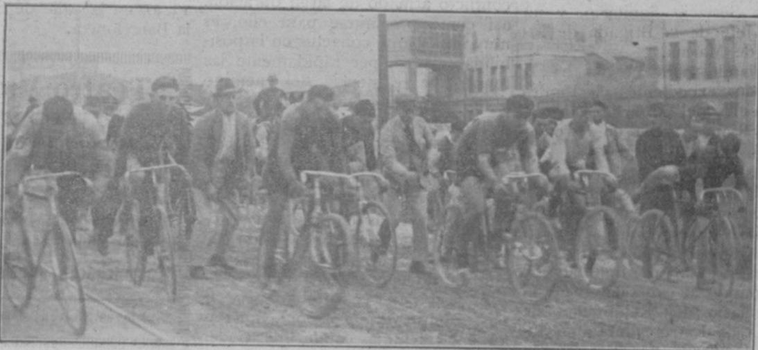
Grupo de corredores en el momento de la salida.