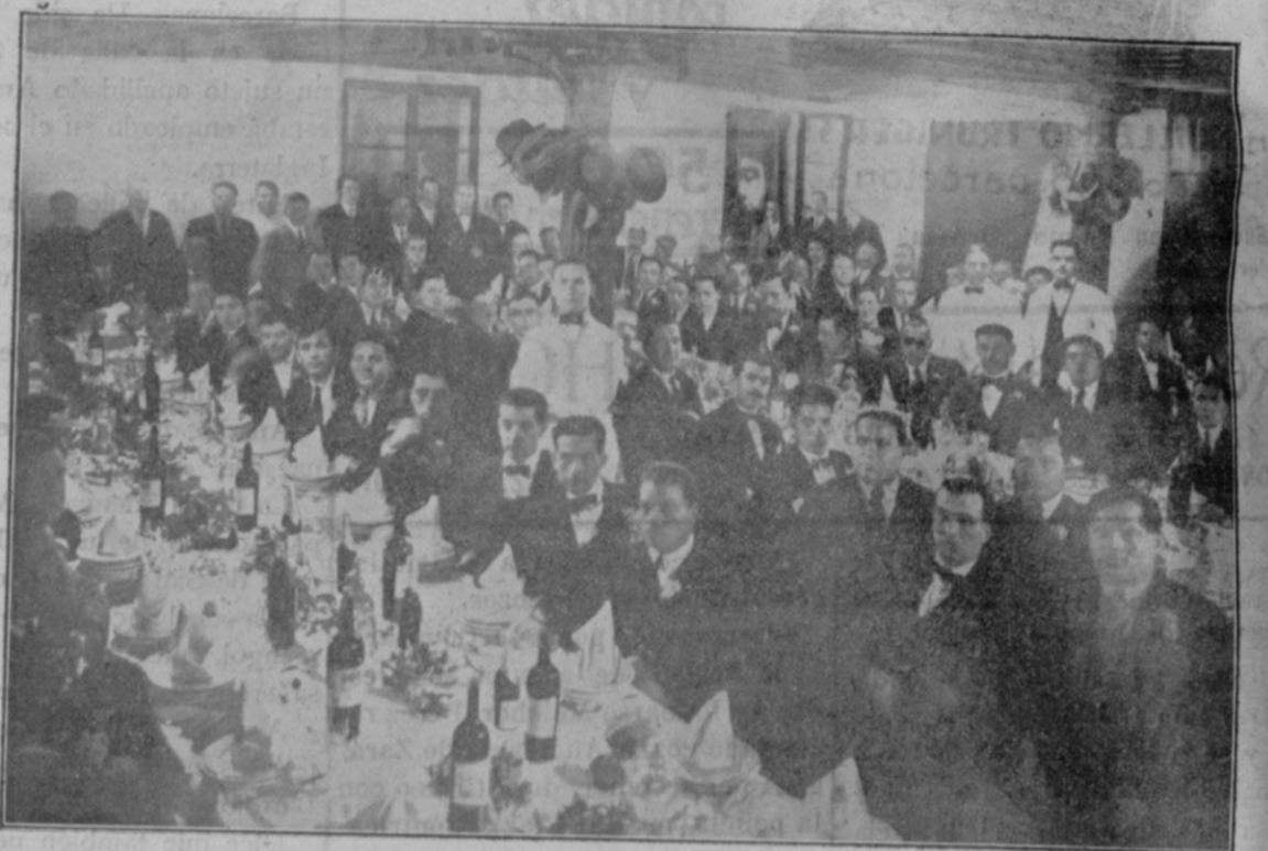
Banquete celebrado en el Hotel Balear para celebrar el cuarto aniversario de su fundación