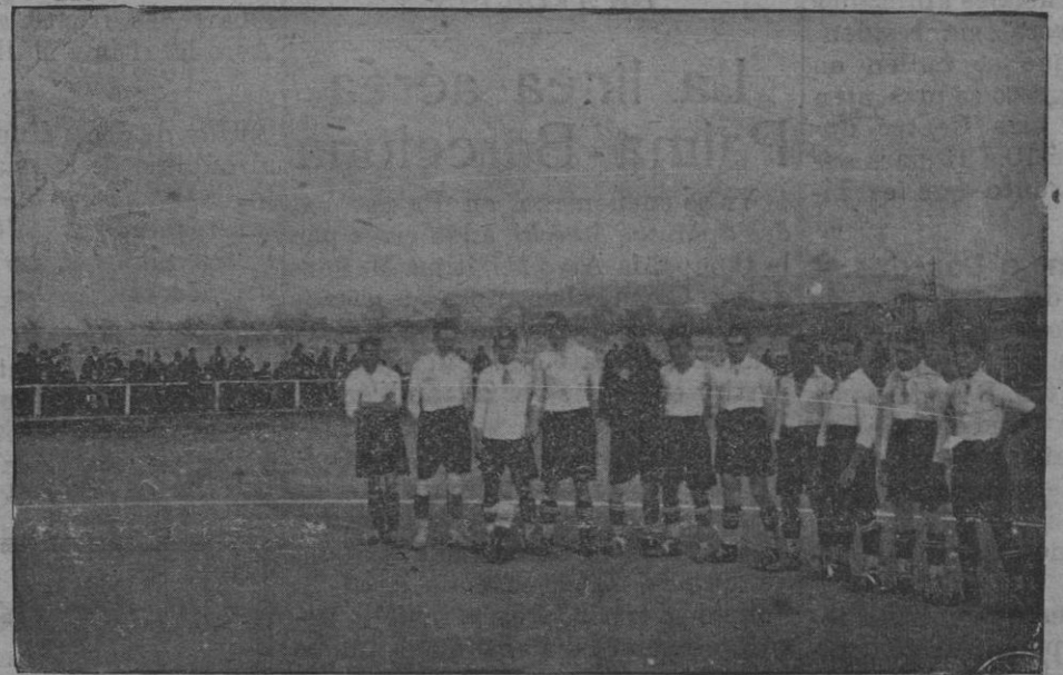
El team del Internaciona.

Entre el Internacional de Barcelona y el Alfonso XIII de Palma