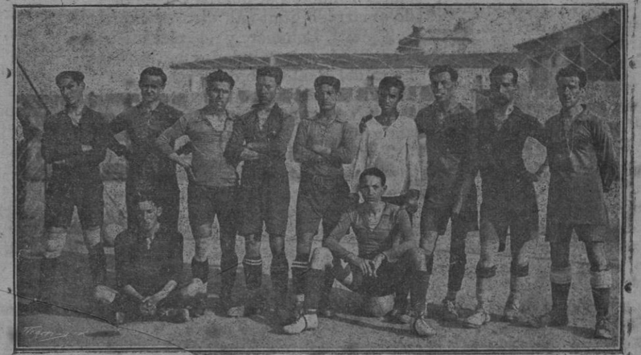
El team del Alfonso XIII.