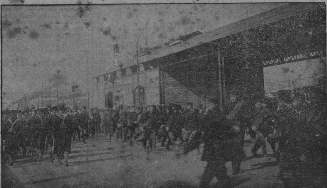
El embarque de los soldados del Regimiento de Palma para Cartagena, para sustituir á los licenciados.

«a x ms», ambrosiens de votre grand Ramón Lull».