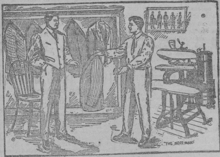
Nuestro establecimiento. — Planchando mientras V. se espera