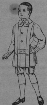
Trajes de lanilla para niños de 4 á 9 años De ptas 12 á 31

Gorras, Sombreros de paja, Cinturones, Calcetines, Corbatas, Fajas, Ligas, Tirantes, Leggings, etc.