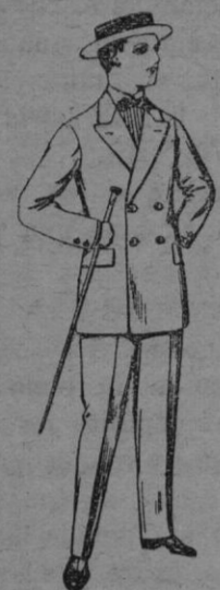
Trajes de lanilla para jovencitos de 10 á 16 años De ptas. 17 á 48