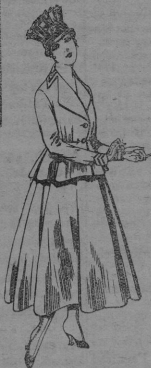
Trajes de lanilla para Señora A pesetas 80