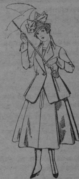
Trajes de lanilla para jovencitas de 13 á 16 años De ptas 53 á 55