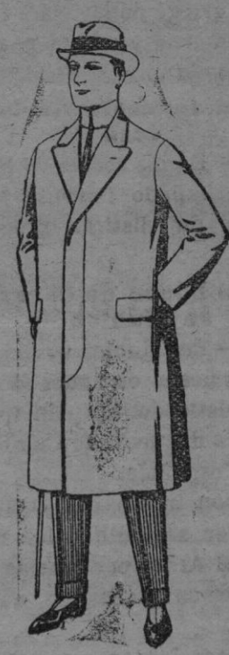
Pardessus de melton ó vagonia De ptas 25 á 100