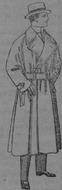
Gabanes Impermeabilizados en color beige De ptas. 65 á 110