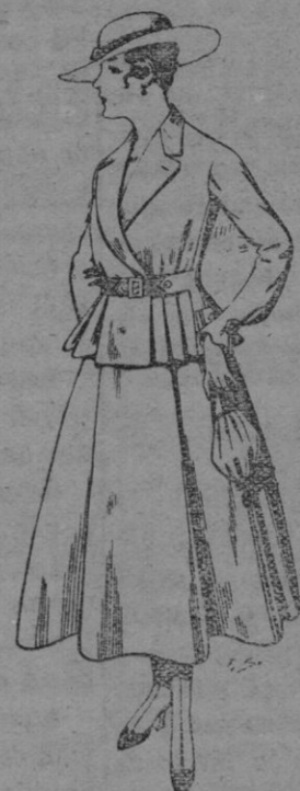
Trajes de lanilla para Señora A pesetas 70