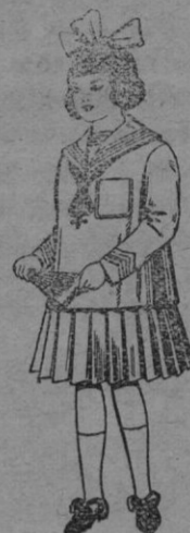
Trajes de lanilla para niña de 4 á 12 años De ptas. 31 á 40

PRECIO FIJO - VENTAS AL CONTADO PIDASE EL CATALOGO GENERAL