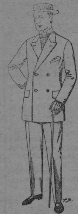
Trajes de vicuña ó jerga negros y azules De ptas 38 á 75