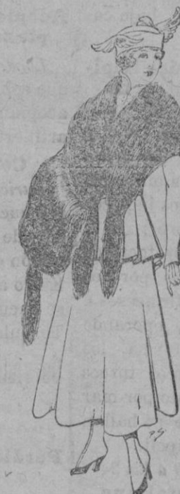
Juego de pieles imitación perfecta al renard negro De pts 40 á 45