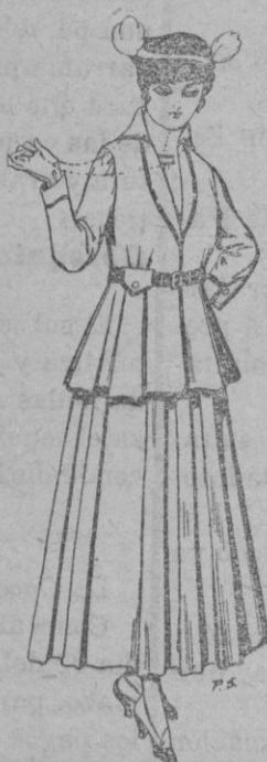
Trajes de lana negra, azul y color, para señora á pesetas 85