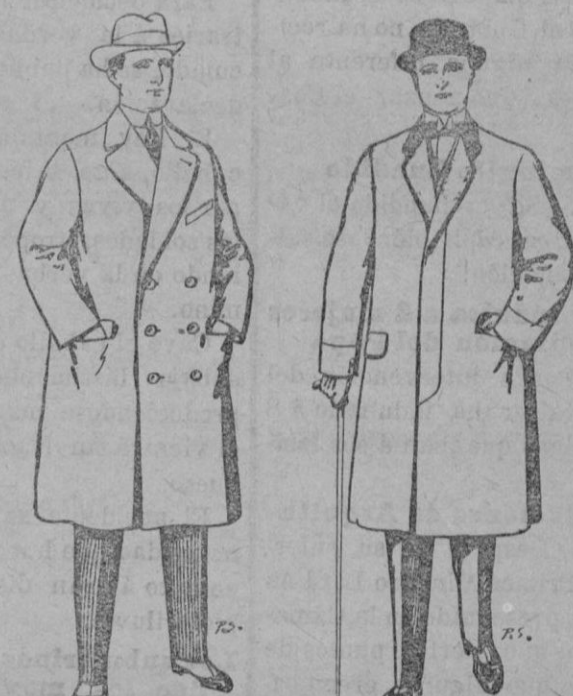
Gabanes de paten ch-evi-ot, etc De pts 55 á 105