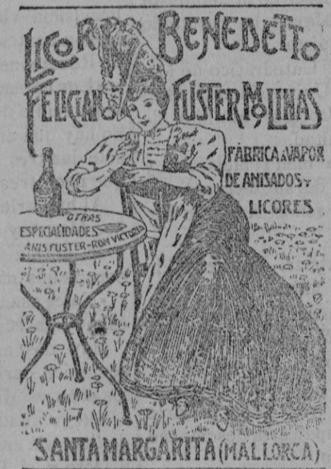
SANTA MARGARITA (MALLORCA)

Notifiza de veinte y siete años de edad y leche de ocho días, se ofrece para criar cristina en su casa que la tiene en Marassi «San Mateo», carteras de laca, distancia once kilómetros de Palma. Informes en la misma.