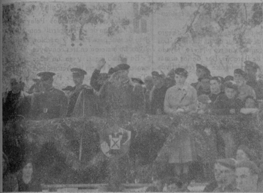
La tribuna presidencial ante la que desfilaron marcialmente los pequeños boinas-rojas

Miles de boinas rojas invadieron, el domingo último, nuestro valle para asociarse al acto de la bendición de la bandera de los Pelayos sollerenses. Solemnes actos religiosos - - - Desfile brillantísimo - - - Gran fiesta deportiva.