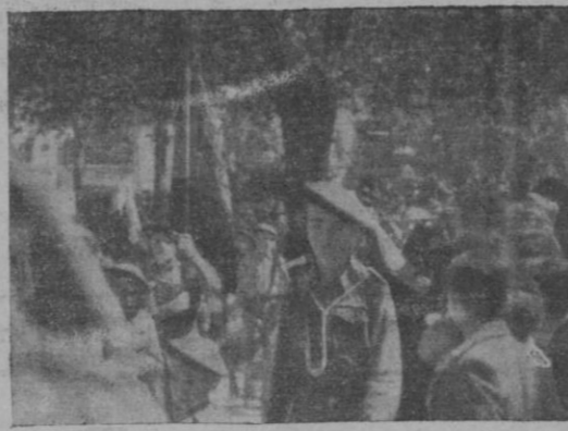
Otro aspecto del desfile que ofrece a la vista el estandarte bendecido

Los Pelayos formaron con rapidez a pesar de las dificultades que representaba el gran número de niños, y comenzó el desfile