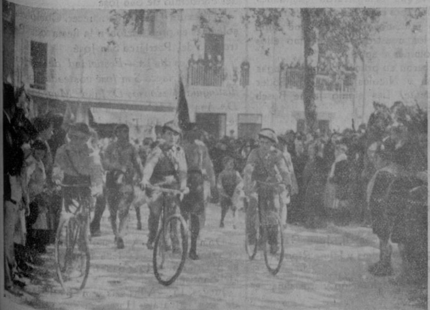
La cabeza de la formación sollerense pasando ante la tribuna presidencial