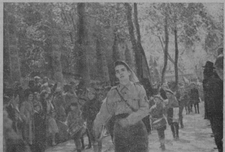
Los Pelayos sollerenses a su paso por la calle del General Franco