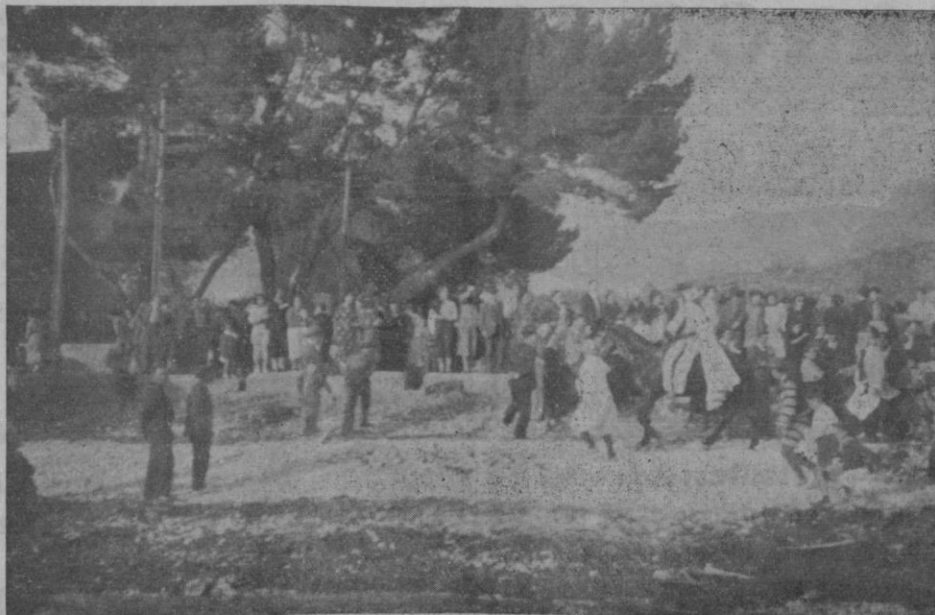
Un aspecto del Firó, en el Puerto de Sóller

La cucaracha, la cucaracha ya no puede caminar porque estas ferias, con tanta lluvia todos nos vamos ahogar.