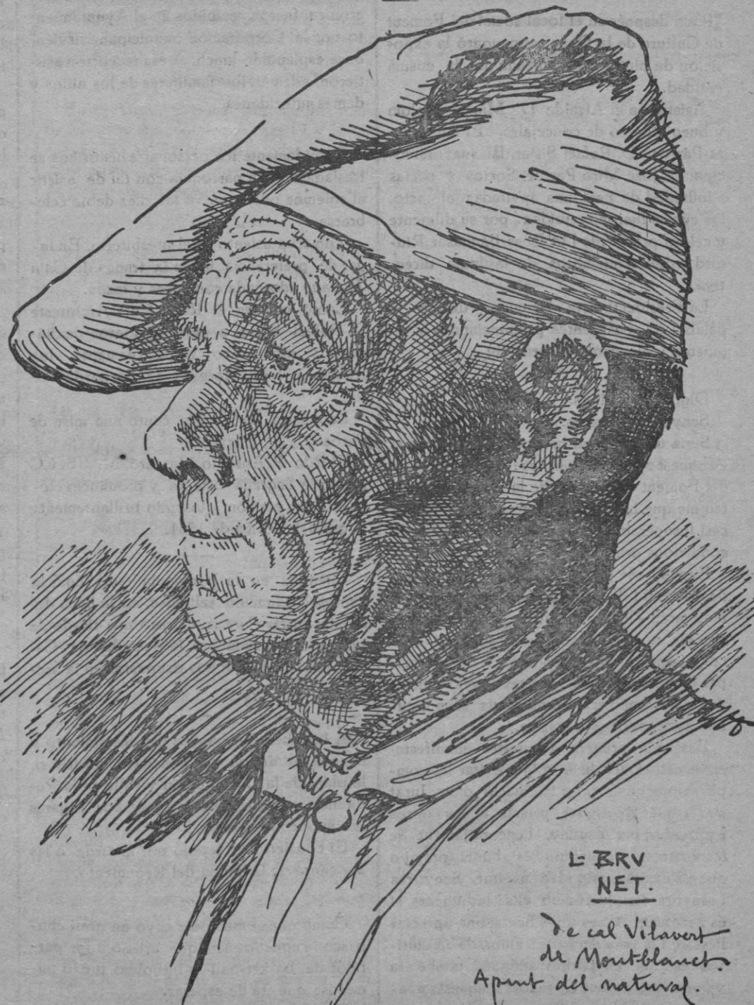
Un típico payés de Montblanch (Tarragona)

DE LA COLECCIÓN DE DIBUJOS «TESTES DE LA TERRA»