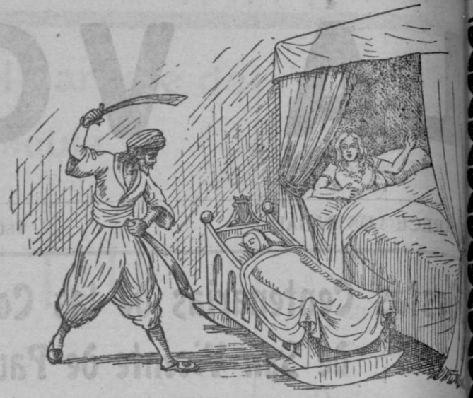
Recordant-se de ses paraules de s'áliga, se destira de s'espada.

El pujen a la forca, i d'allá dalt demaná una gracia, sa gracia de poder contar es com i es perque havia taiat es cap de s'infat.