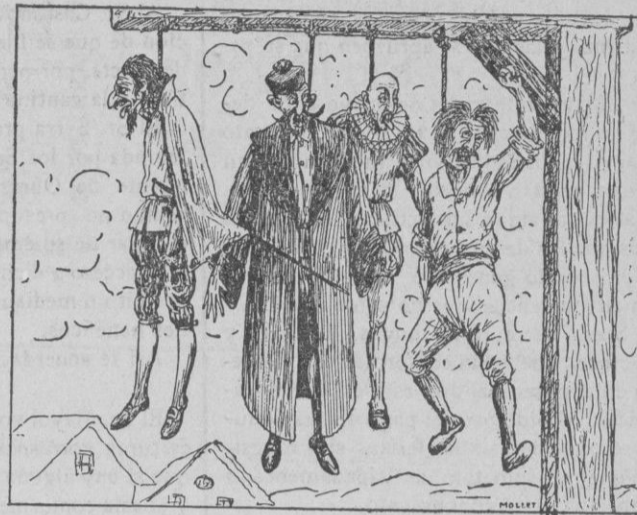
Al instant los tengué tots amb un pam de llengo defora

Y encara no hu hagué acabat de dir, com aquell dogal se despassa des seu coll, y ja hagué embolicats tots es colls des qui componien la Justicia y des botxi, y al instant los tengué tots amb un pam de llengo defora y afeçats, perque En Pere may digué: basta! sino que sen anà saltant y botant d'alegria, aferrat ab so moix y es ca, donantlos aferrades pes coll y besades, y lo mateix ferer son pare y sa mare plorant de goig come nins petits, com el verén escàpol.