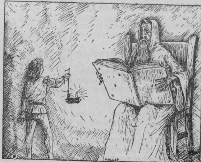
S'hi acostà a ferli llum, y aquell senyor lilitx qui lilitx

S'al·lotó se pensà que allò era es senyor de la casa, y no li feu gens de por.