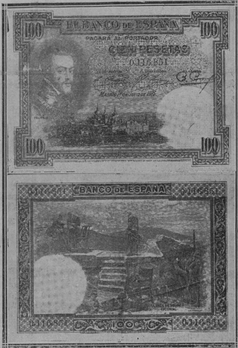
Anverso y reverso de los nuevos billetes de cien pesetas que ha puesto en circulación el Banco de España al proceder a la recogida de los de la serie D, con motivo de la falsificación descubierta recientemente

cuyo «interview» doy a la publicidad por afectar a uno de los más populares y estimados hijos de nuestra nunca bien ponderada ciudad.