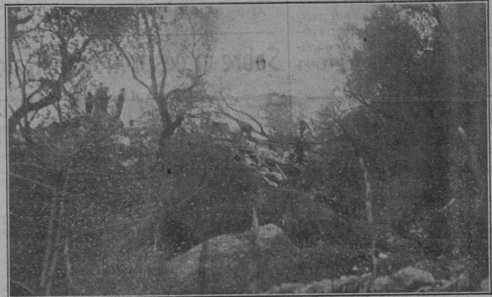
Grupo de curiosos contemplando el abismo que se abrió en lá ladera del monte