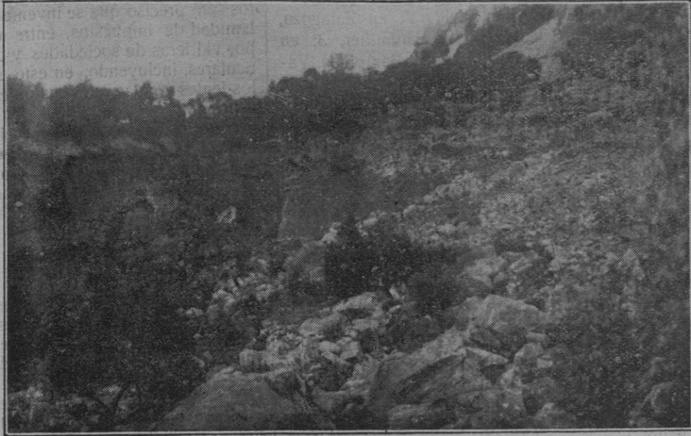
Hoyo que se formó a causa del deslizamiento de tierras