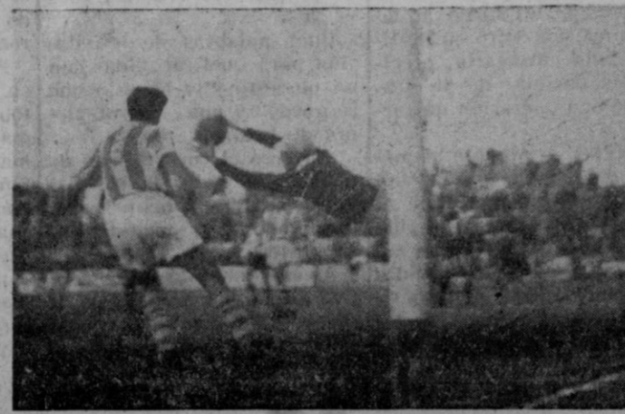
Dos interesantes jugadas del partido Al. Baleares-Linense