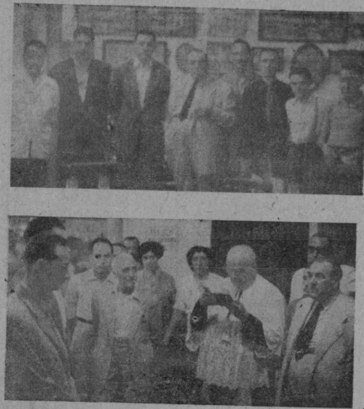
Actos de la bendición e inauguración del Club Ciclista "Hostalets".

El Real Madrid se disputará el título de campeón del mundo en el fútbol de salón.