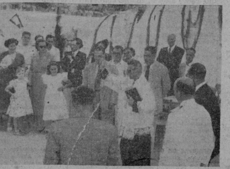
DOS ASPECTOS DE LA SOLEMNE BENDICIÓN E INAURACIÓN DEL CLUB NAUTICO DE SOLLER, EFECTUADAS AYER EN LA CIUDAD DE LOS NARANJOS.