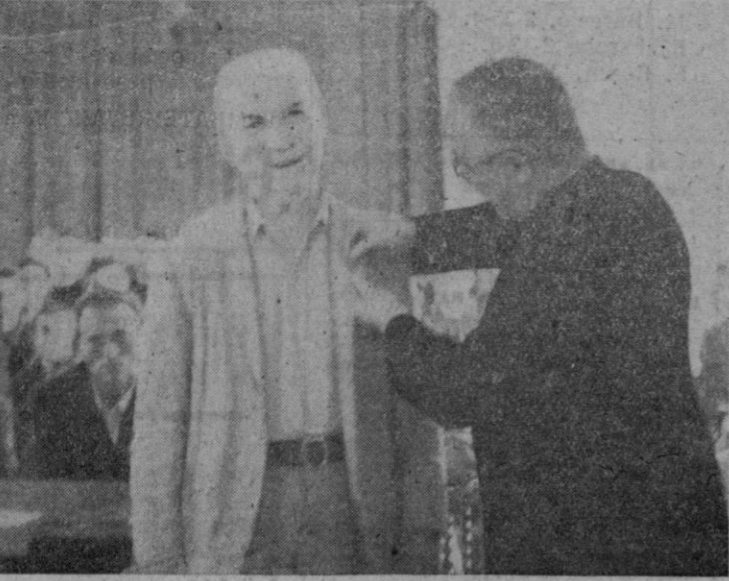
ARRIBA: EL "SALON DE LA INFANTA EN LLUCH, DURANTE LA ASAMBLEA DE LOS ANTIGUOS "BLAVETS". ABAJO: LA INSIGNIA, IMPUESTA AL MAS ANTIGUO.