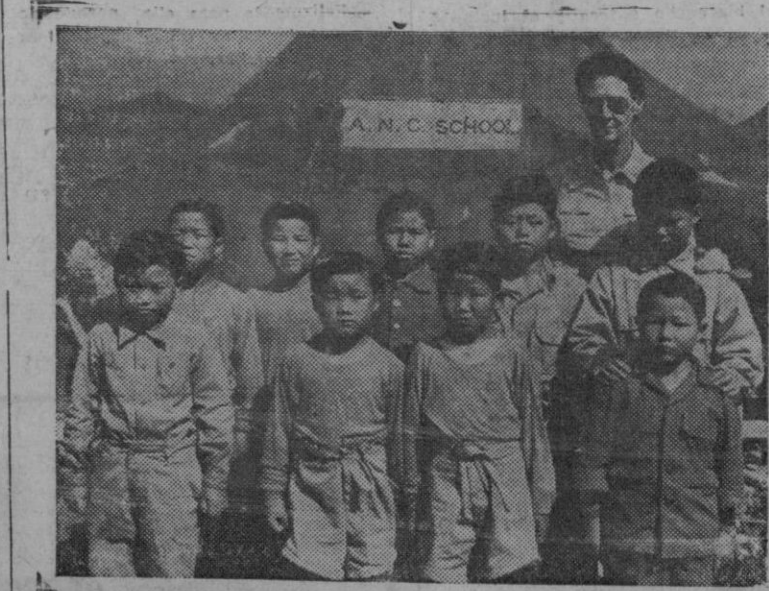
Hijos de nortecoreanos capturados por las fuerzas de las Naciones Unidas, son atendidos por las enfermeras de los EE. UU., las cuales atienden a estos muchachos, dándoles la oportunidad de continuar su educación que fue interrumpida por la invasión comunista en Corea

Una casa quedó reducida a cenizas y tres totalmente destruidas. Se salvaron las bestias, varios muebles y orano que había en las casas, pero quemaron la leña y la paja.