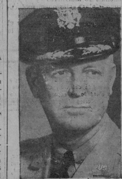
El Tente. General Otto P. Weyland, que acaba de ser nombrado Comandante de las Fuerzas Aereas norteamericanas en el Lejano Oriente