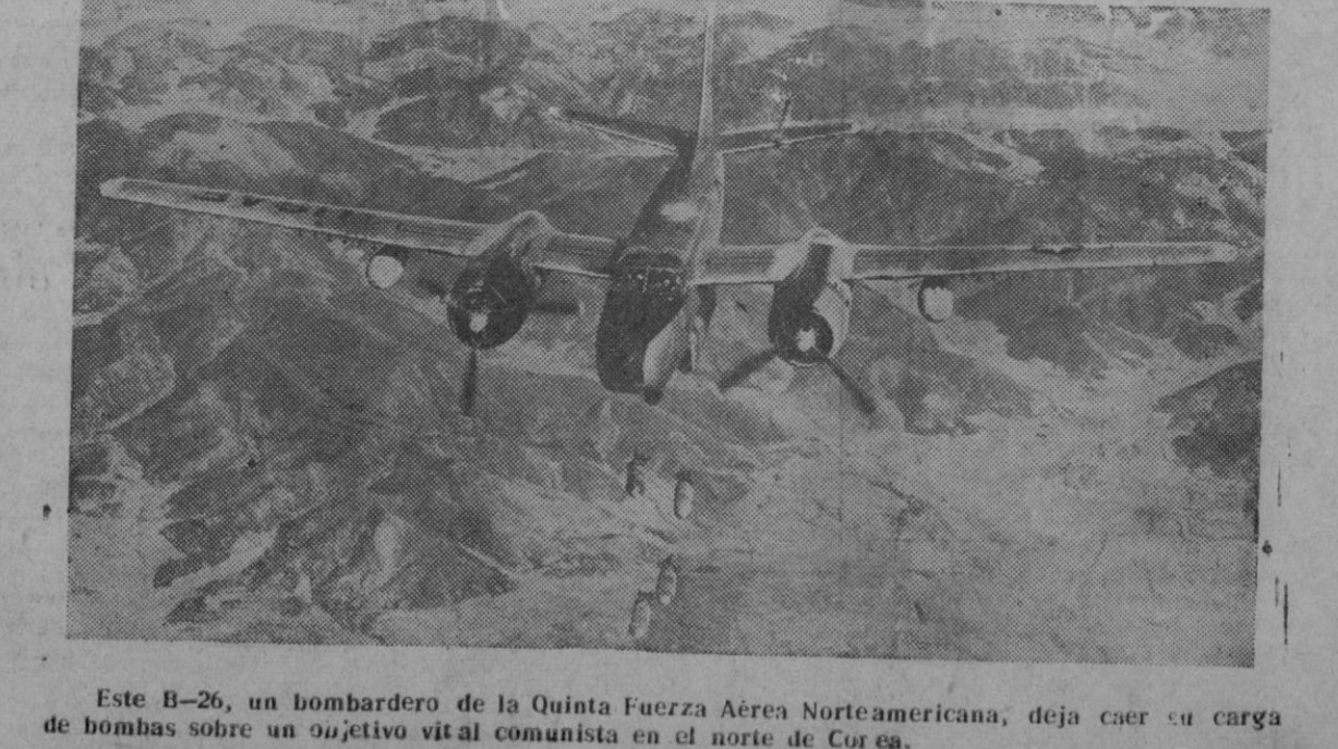
Este B-26, un bombardero de la Quinta Fuerza Aérea Norteamericana, deja caer su carga de bombas sobre un objetivo vital comunista en el norte de Corea.