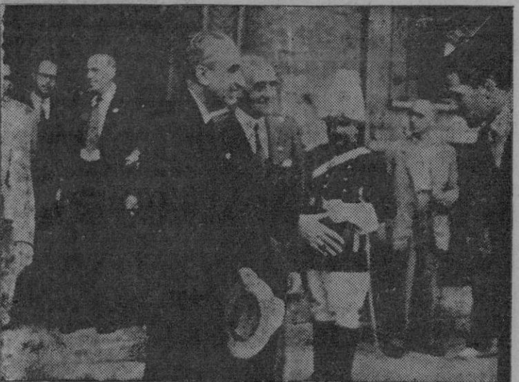
El Excmo. Sr. Gobernador Civil, al abandonar el Ayuntamiento.