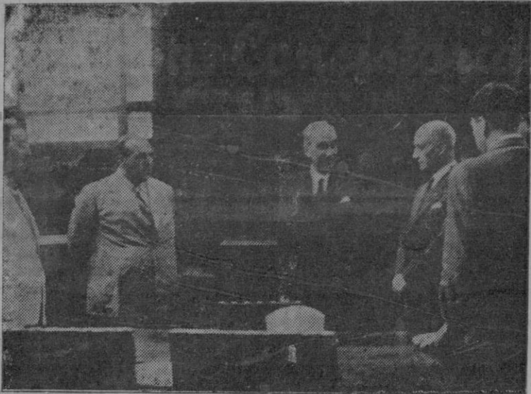
El Sr. Barón de Benasque, conversando con el Alcalde y Concejales, en el Salón de Sesiones.