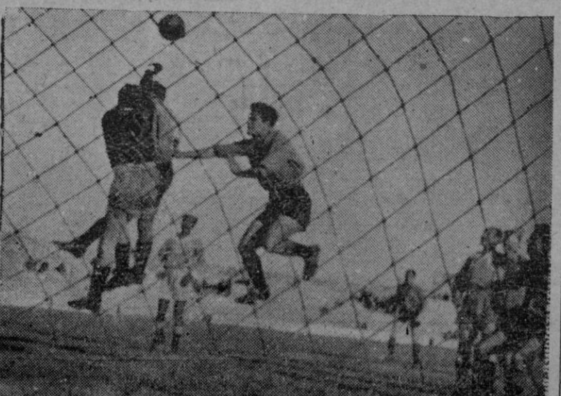
Una interesante jugada del partido Badalona-Mallorca jugado en Es Fortí