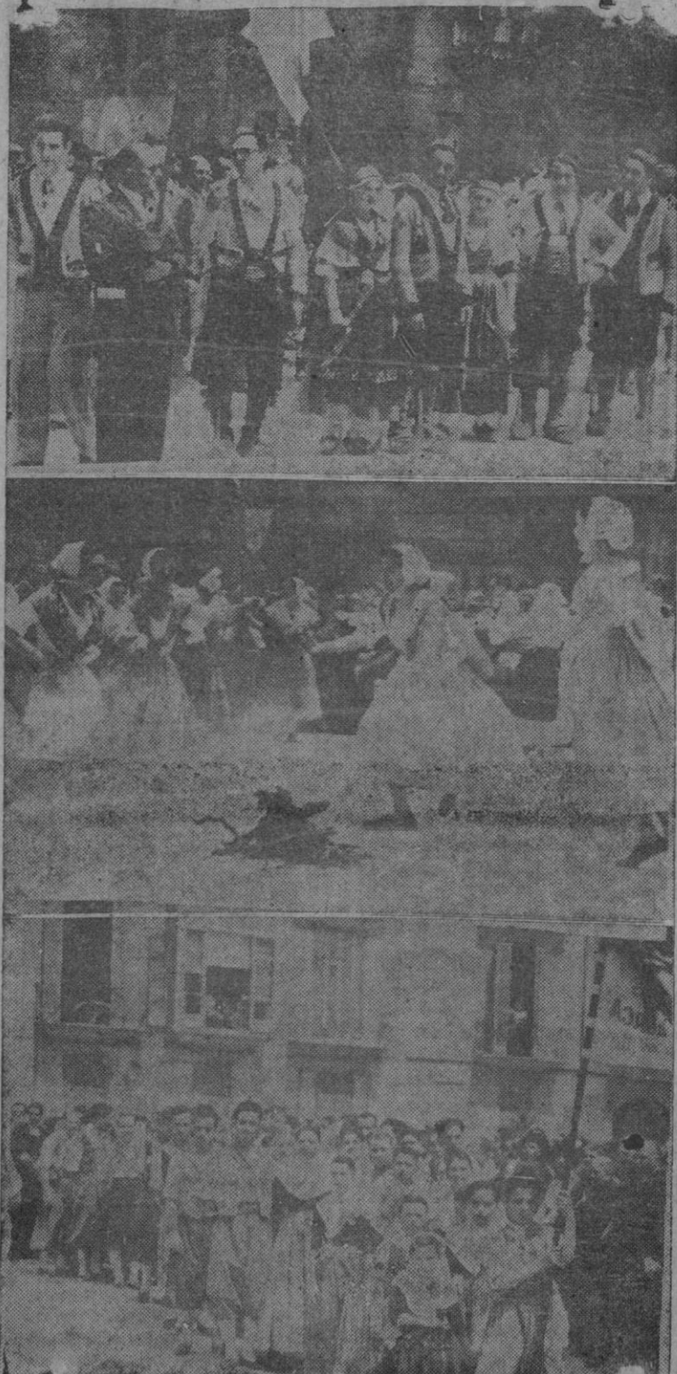
Del céstile toikiorista