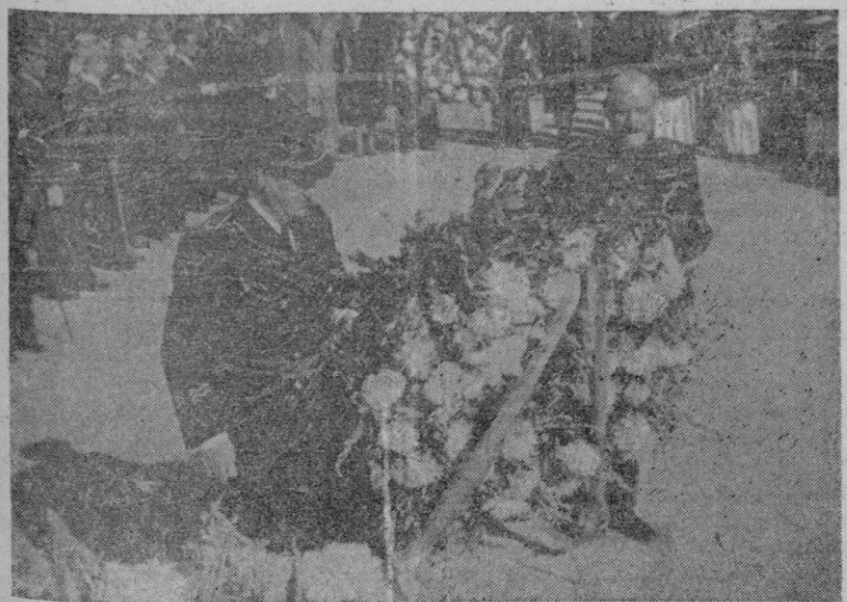
Aunque con algún retraso, nos com placemos en publicar hoy una foto del acto del Día de los Caídos, que por premuras de composición se traslapó en ediciones anteriores. Nuestra primera Autoridad Civil y el Subjefe de Falanga depositan una Corona ofrenda del partido.