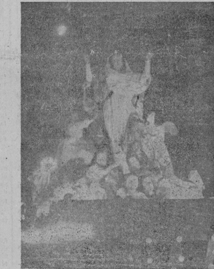
La carroza que figuró en el sole mne rosario del martes, vispera del acto de la proclamación del dogma.

Washington.— Se conocen más detalles del intento de asalto a la residencia de la Blair House del presidente Truman. De los dos individuos que participaron en el mismo, uno murió al llegar al hospital. El otro está gravemente herido.