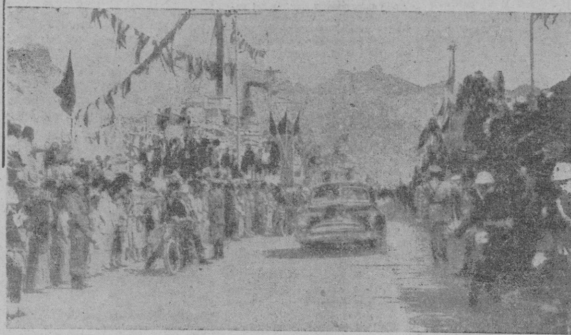
Detalle de la llegada del Caudillo a Santa Cruz de Tenerife