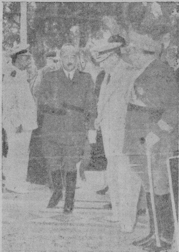
El Jefe del Estado en la Capitanía General de Canarias